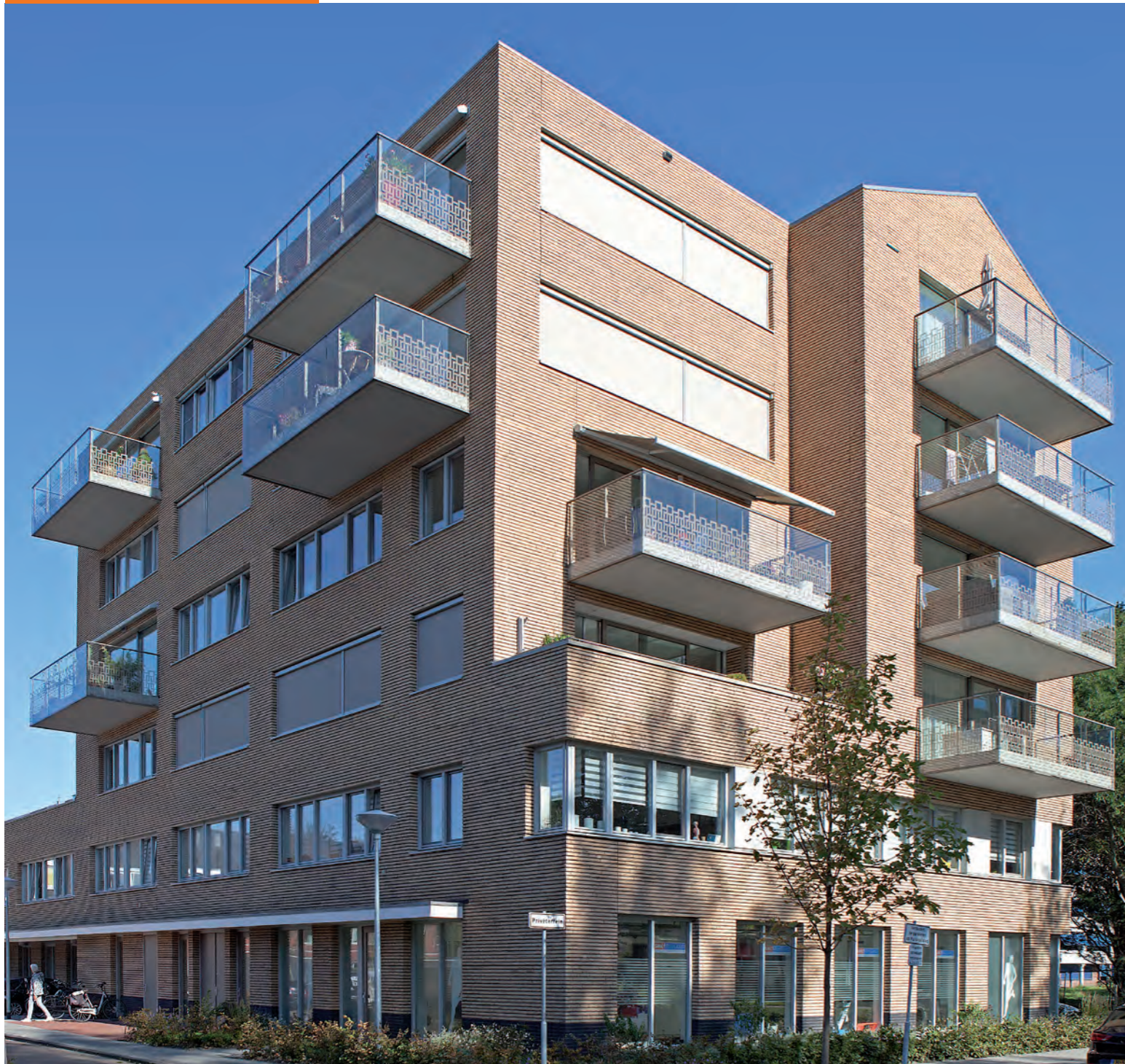
WONINGEN EN APPARTEMENTEN PARK DIEPERHOUT, LEIDEN